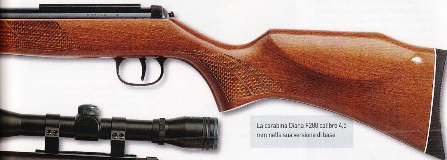
La carabina Diana F280 calibro 4,5 mm nella sua versione di base

Un aspetto che qualifica le F280 rispetto ai vecchi modelli è il calcio, sempre di legno di faggio ma ora dotato di due poggia-guancia, uno per ogni lato; inoltre l'astina si prolunga in avanti fino a coprire completamente il manicotto di culatta della canna, cosa che conferisce a queste carabine una linea molto più simile a quella di un'arma da fuoco. Un bel calciolo di gomma guarnisce degnamente la pala del calcio e anche in questo caso dà un'aria molto più "seria" all'arma, mentre un tocco di modernità deriva invece dal disegno degli zigrini dell'astina e dell'impugnatura a pistola.