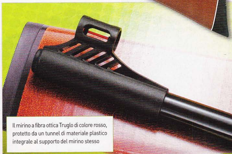
Il mirino a fibra ottica Truglo di colore rosso, protetto da un tunnel di materiale plastico integrale al supporto del mirino stesso