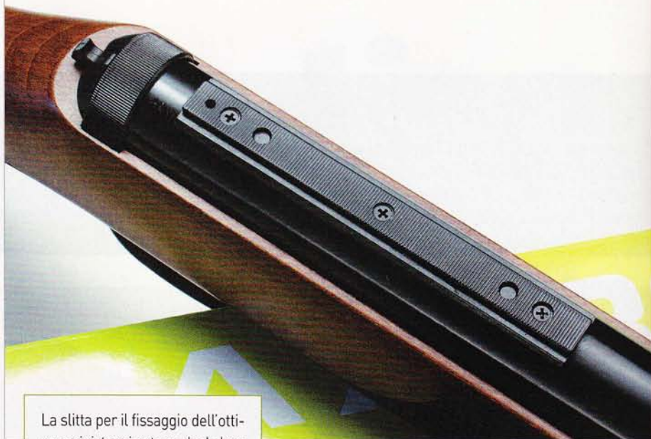
La slitta per il fissaggio dell'ottica; a sinistra si nota anche la leva della sicurezza manuale

▲ privo delle mire tradizionali e ovviamente è obbligatoriamente destinato ad accogliere un cannocchiale di puntamento; per il suo fissaggio (ma questo vale anche per la F280 di base) non ci sono problemi, perché è stata prevista una slitta d'attacco a coda di rondine sulla sommità del cilindro. La dotazione di serie dell'F280 Professional non comprende l'ottica, tuttavia la stessa Diana ne offre una buona scelta, contraddistinta da prezzi contenuti, che illustriamo in queste pagine; tutti questi cannocchiali Diana hanno il reticolo inciso su una lente, in modo da resistere alle sollecitazioni inferte dalle armi ad aria compressa. Altre caratteristiche che differenziano la F280 Professional dalla versione di base sono la presenza di un vistoso contrappeso in volata (pensato allo scopo di renderla più stabile durante la fase di puntamento) e la rifinitura nera satinata.